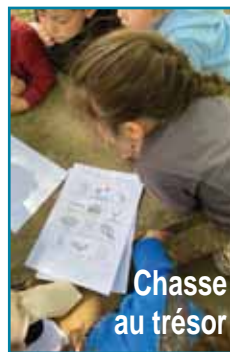
Chasse au trésor