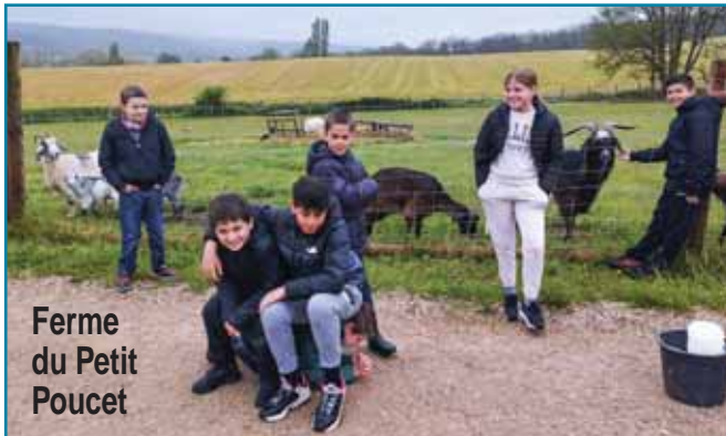
Ferme du Petit Poucet