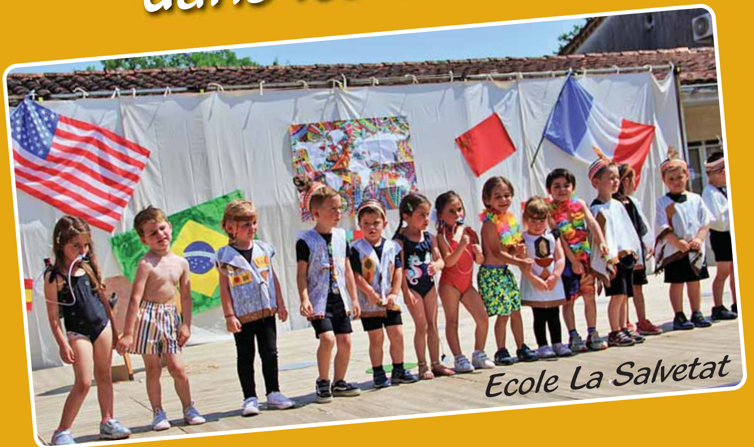
Ecole La Salvetat