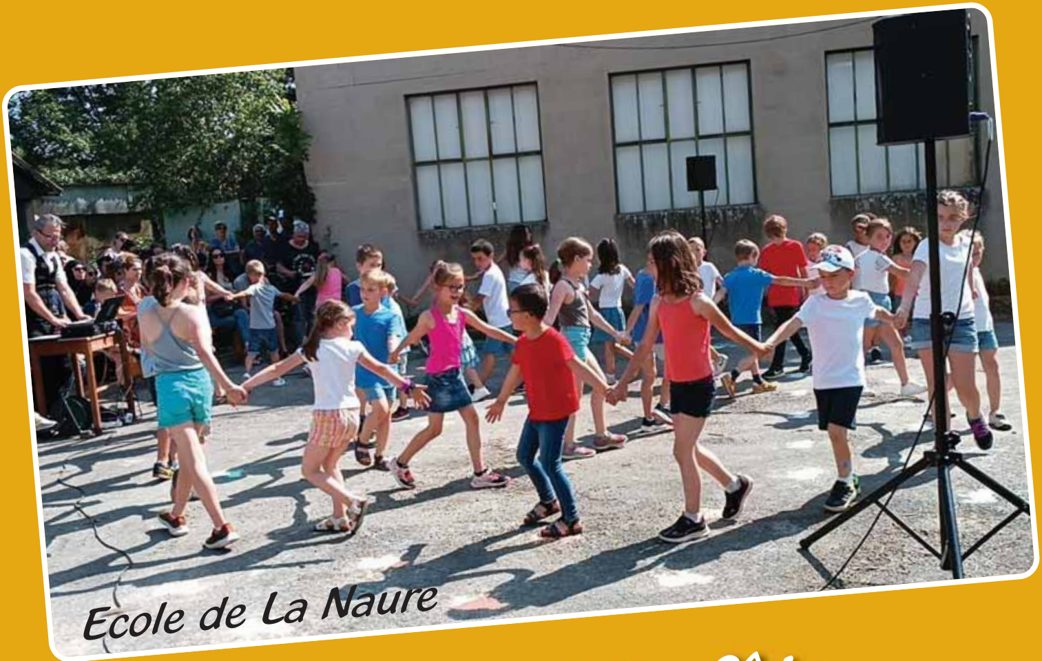
Ecole de La Naure